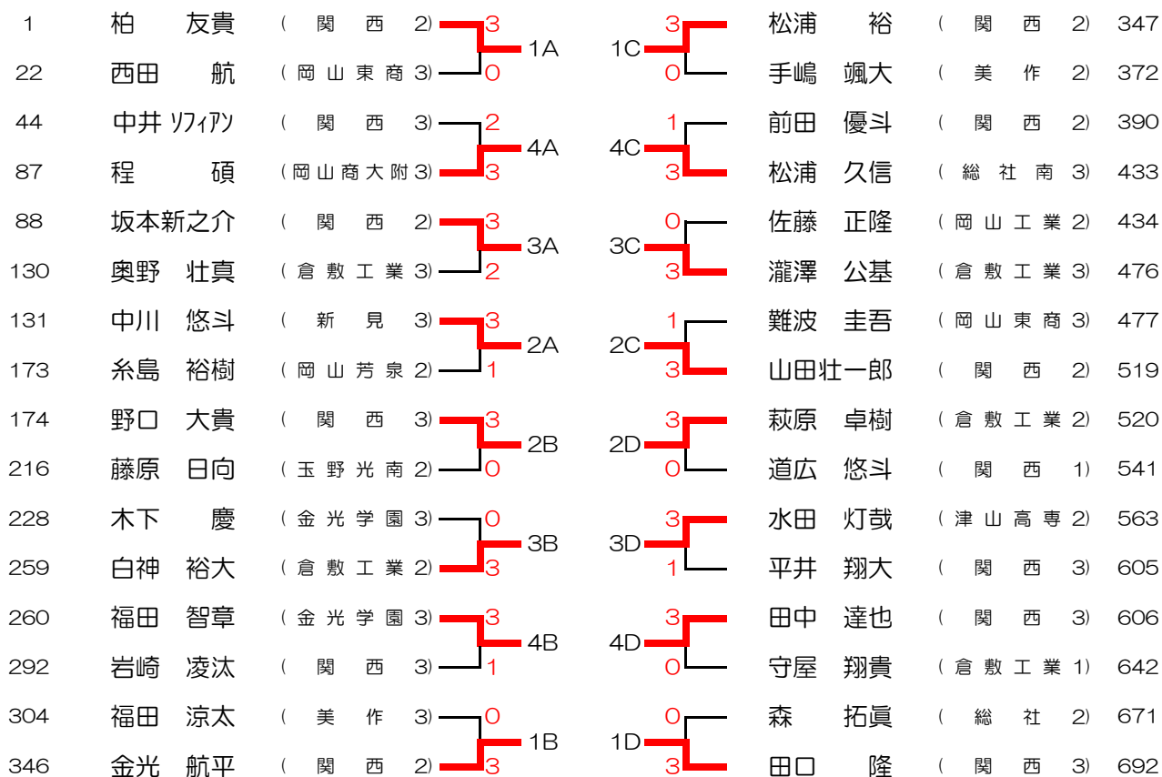
《1次リーグ》1・2コート